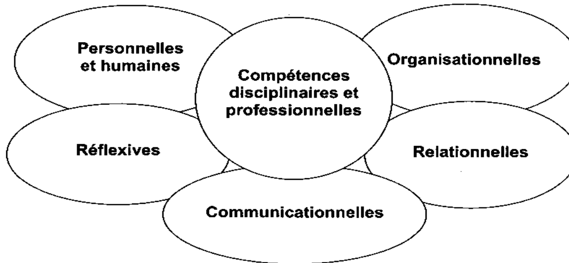
Figure 2.1 Typologie des compétences à développer chez les étudiants dans le cadre d'un programme d'études.